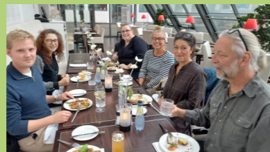
TR'erne på kongres—vi holder frokost-pause

Den nye folkeskoleaftale indeholder flere andre punkter, specielt juniormesterlære og timebank. Kredsen har arbejdet med emnerne, så tillidsrepræsentanterne er klædt på til samarbejdet, når det skal indføres på skolerne. Begge dele skal sammen med den styrkede indsats for de 10 % svageste i dansk og matematik, indføres fra næste skoleår.